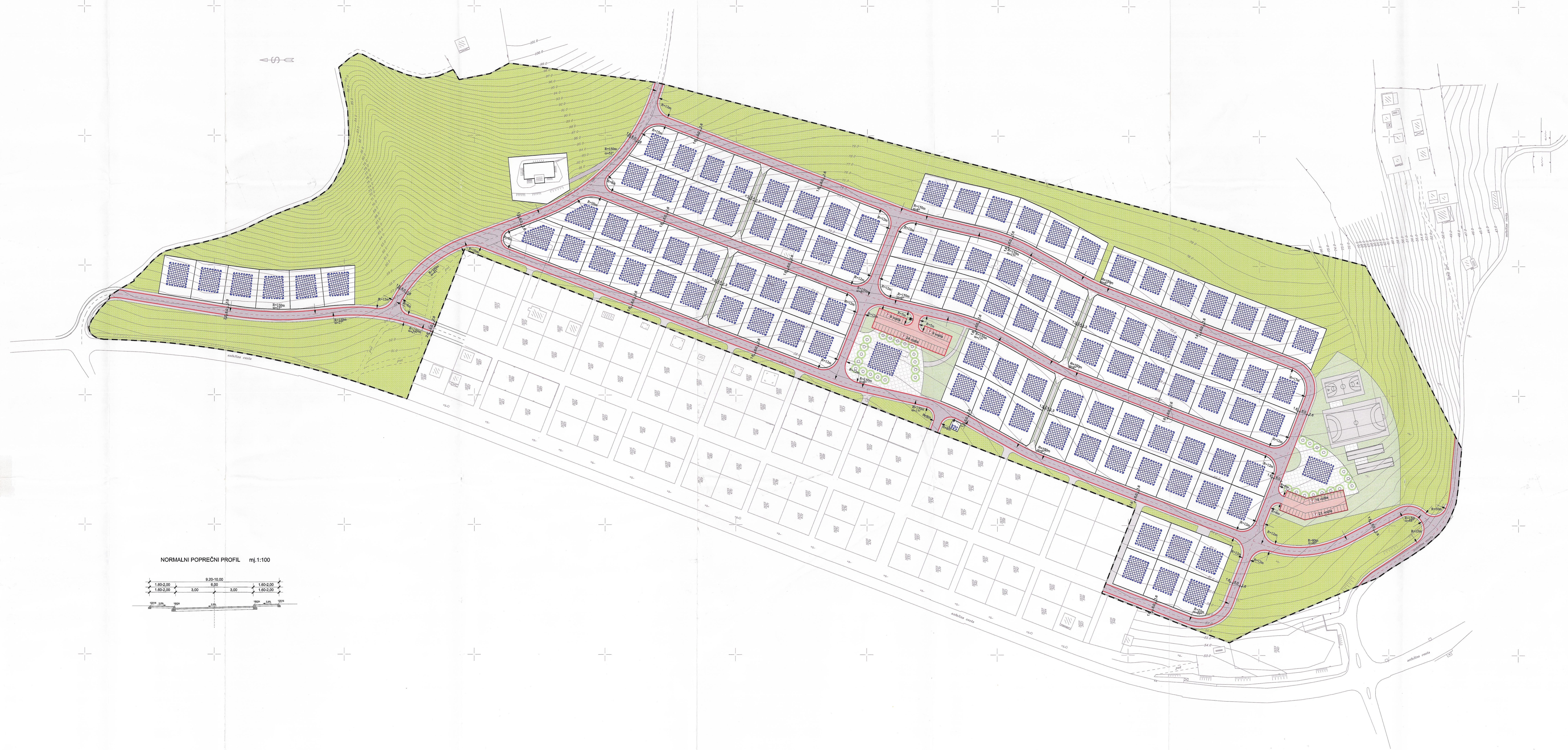
NORMALNI POPREČNI PROFIL mj.1:100