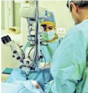
Pacijenti su sada još više ograničeni na liste čekanja